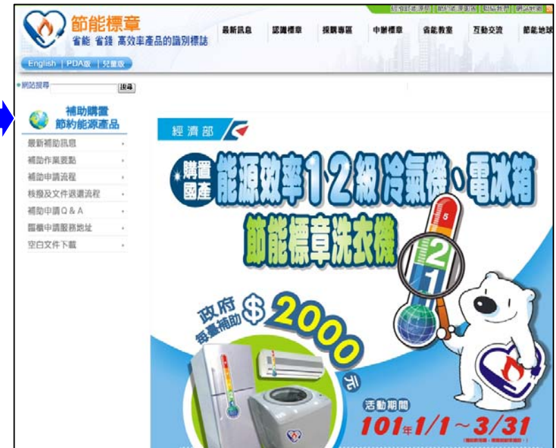
節能標章網站補助案頁面示意圖